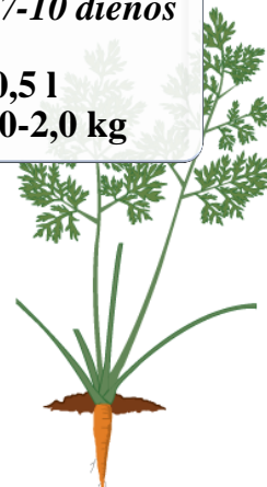
[BBCH Code 41]